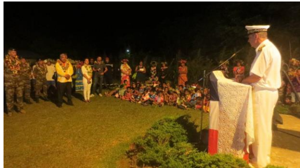
Cérémonie d'accueil à la mairie de Ahurei

La délégation s'est ensuite rendue à la mairie de Ahurei où la population, les agents communaux, les sapeurs-pompiers volontaires de Rapa, les élèves de l'école primaire de Tevii, le corps enseignant, le contingent du RIMaP-P, les équipes sportives des quatre clubs de Rapa (AS Tevaitau, AS Tiare Taina, AS Teparima et AS Vaipiri), les responsables de services et techniciens de l'Etat et du Pays les attendaient.