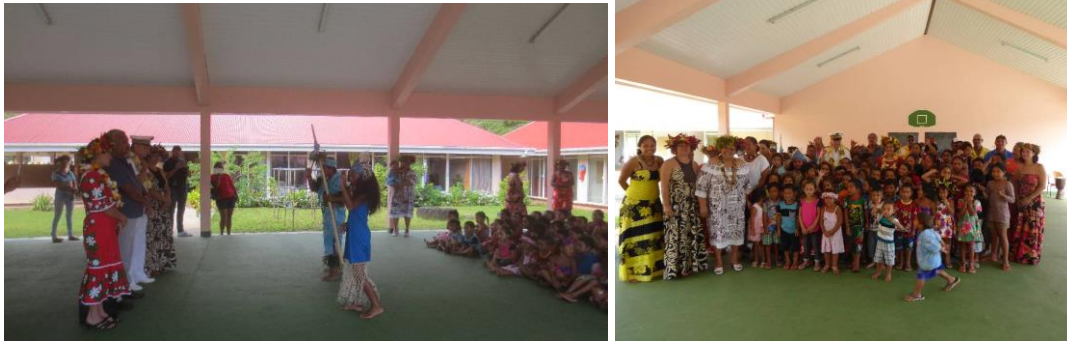
Ecole maternelle et primaire de Tevii

* l'école maternelle et primaire de Tevii où un accueil leur a été réservé par les élèves.